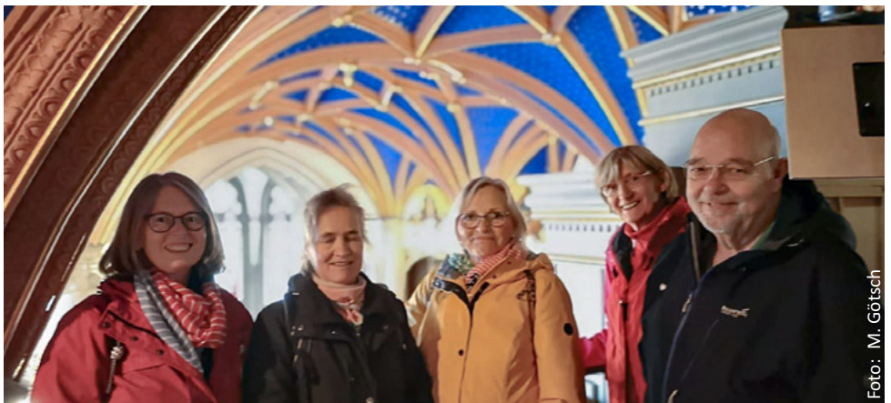
Küsterausflug in die Schweriner Schlosskirche