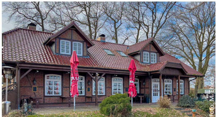
Das Gasthaus heute

Vielen Dank an Familie Werner für die Informationen und Familie Dühr für die Fotos!