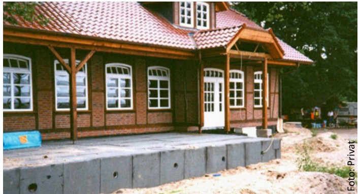
Der Neubau 1994