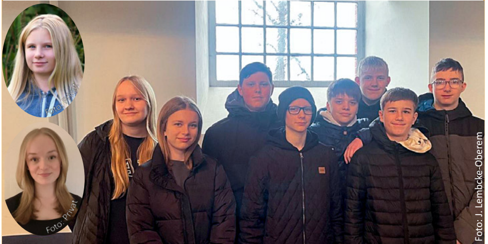
Unsere Konfirmandinnen und Konfirmanden 2024

Der Konfirmationsgottesdienst findet statt am 21.04.2024 um 11:00 Uhr in der Lütauer Kirche