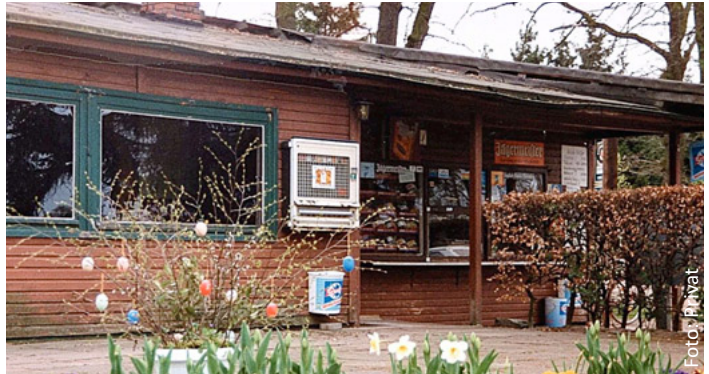
Der Kiosk bis 1993

Im Jahr 2012 ging es in den Besitz der heutigen Betreiber über und bietet den Gästen in uriger und gepflegter Atmosphäre von Eis über Kuchen bis hin zu gutem Essen alles, was das Herz begehrt. Und dabei kann man drinnen wie draußen den schönen Blick auf den Lanzer See genießen.