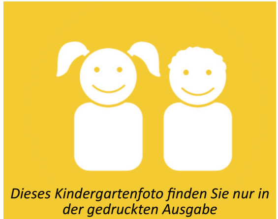
Dieses Kindergartenfoto finden Sie nur in der gedruckten Ausgabe